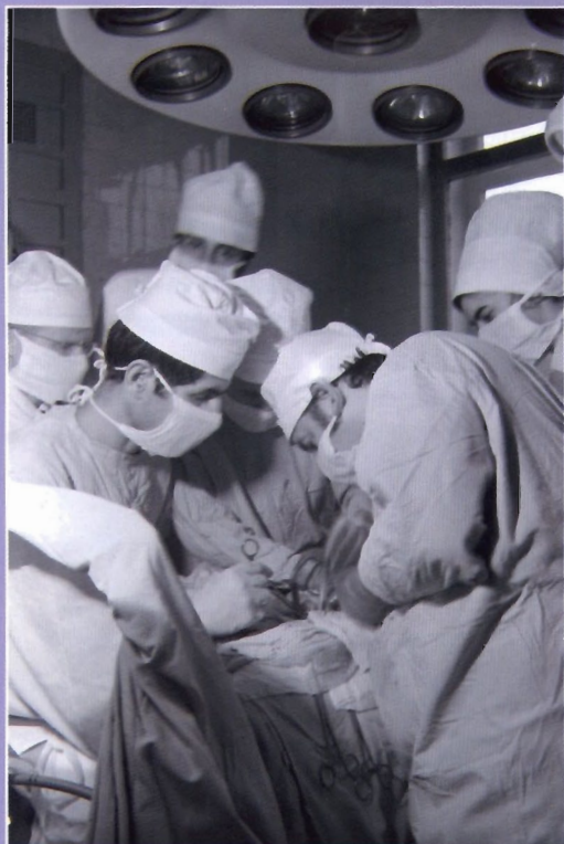
Операция на кафедре урологии 2 МОЛГМИ им. Н.И. Пирогова