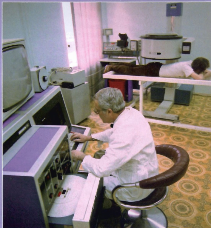
В радиоизотопной лаборатории НИИ урологии (1987 г.)